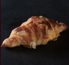
アーモンドクロワッサン