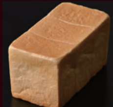
[サイズ:1.5斤] キャッスルブレッド