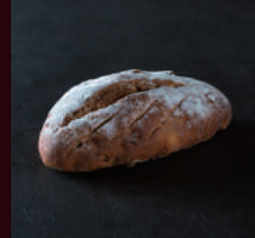
いちじくとくるみのパン