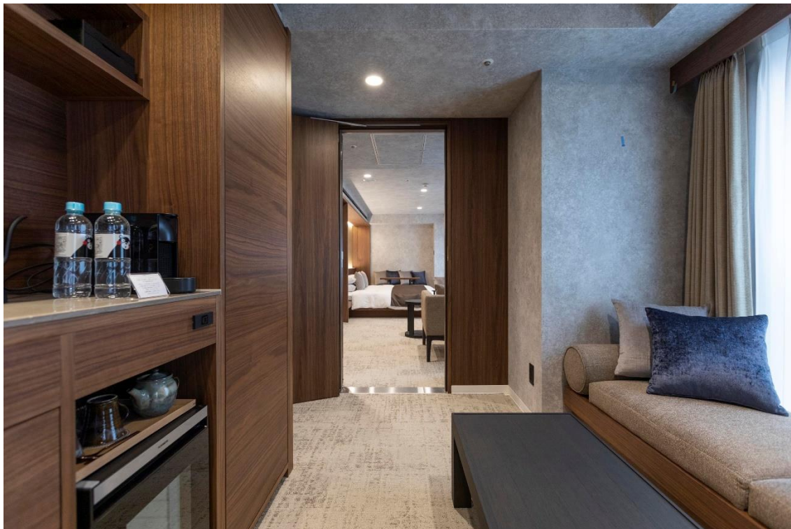
コネクティングルーム対応の「デラックスキングダブル」「デラックスクイーンダブル」(1組) (ダブルルーム2部屋をつなげることにより最大4名様まで収容可能)

生まれ変わったゲストルームは、「デラックスキングダブル」(6室)・「デラックスクイーンダブル」(5室)・「デラックスキングツイン」(6室)の3種類 全17室。その中にはユニバーサル仕様のタイプ、コネクティングルームとしての利用が可能なタイプもあり、お客様からの多様なリクエストにお応えできるゲストルームです。