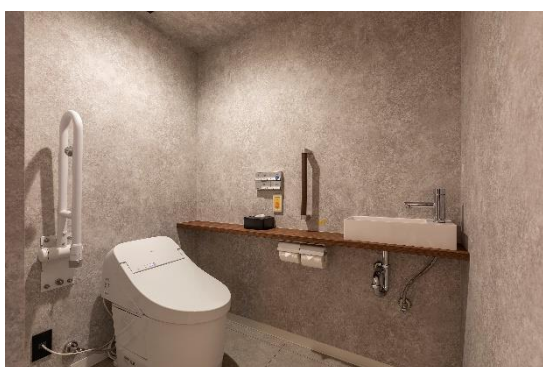
ユニバーサルルームのトイレ (広い間口と手すりを設置)