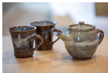
急須とマグカップ (小代焼 ふもと窯)

改装に合わせてゲストルームの小物も一新。観光や旅行などの用途でご滞在のお客様にホテル内でも「熊本らしさ」を感じていただくため、熊本県荒尾市の「小代焼 ふもと窯」でひとつひとつ制作されたマグカップ、バスアメニティのパッケージには熊本市木の「イチョウ」、市鳥「シジウカラ」、市花「肥後ツバキ」をあしらったデザインのボトルを新たに制作し、他の部屋との差別化を実施。エントランスには、部屋ごとに異なるデザインのオーナメントがお客様をお迎えいたします。泊まって眠るだけの部屋ではなく、人の手が加わった温かいおもてなし