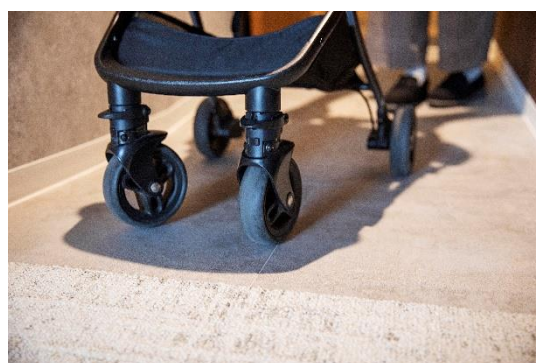
ユニバーサルルーム エントランス (室内には段差がなく、昇降しやすいつくり)

改装前のシングルルーム3部屋を1部屋にした「デラックスキングダブル」・「デラックスキングツイン」は、ゆとりのあるリビングルームとベッドスペース、十分なスペースのウォークインクローゼットを設置。第1期工事完了後、リニューアルし新しくなったゲストルームにお