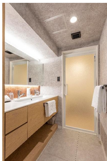
ツーベysin洗面台とバスルーム